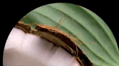
COCCO Coco Coconut