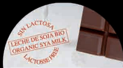
CIOCCOLATO SOIA Chocolate con Leche de Soja Soya Milk Chocolate