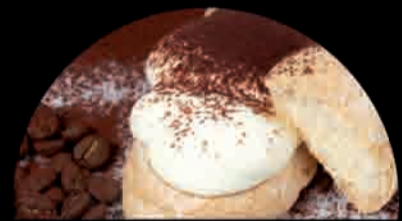
TIRAMISU Huevos, Galletas y Café Eggs, Biscuits, Coffee