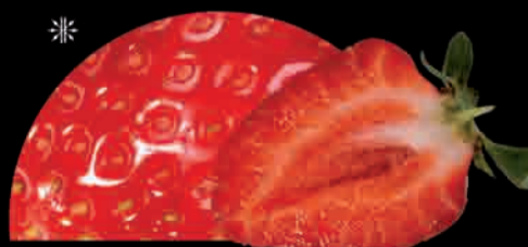
FRAGOLA Fresa Strawberry