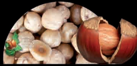
NOCCIOLA TONDA E GENTILE DELLE LANGHE Avellana Hazelnut