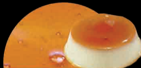
CREM CARAMEL Crema Caramelo Crem Caramel