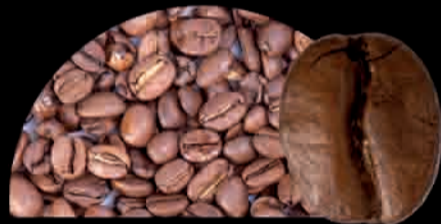
CAFFÈ Café Coffee