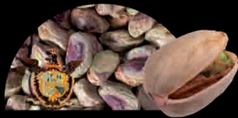
PISTACCHIO 100% PURO BRONTE Pistacho Pistachio