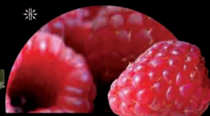
LAMPONE Frambuesa Raspberry