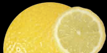
LIMONE Limón Lemon