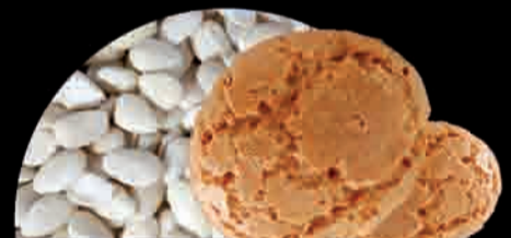
AMARETTO Galleta de Almendras Almond Biscuits