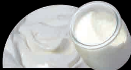
YOGURT Yogurt Yoghurt