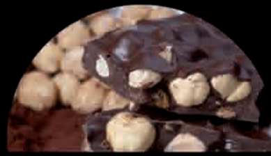
BACIO Bacio Hazelnut Chocolate