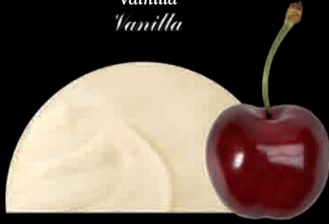
AMARENA Vainilla con Cerezas Vanilla and Cherries