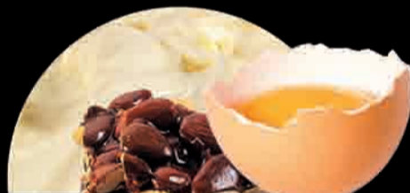
CREMA AL CROCCANTE Crema Pastelera Italiana Italian Confectioner's Custard (pastry cream)