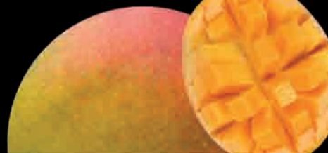
MANGO Mango Mango