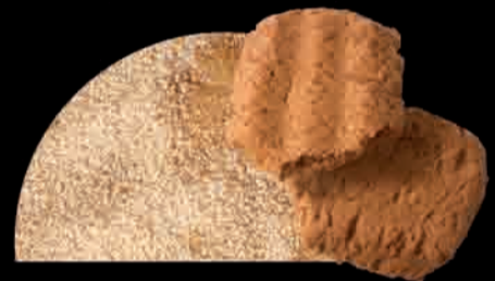
BISCOTTI Galleta Biscuits