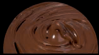
L'INIMITABILE El Inimitable The incomparable