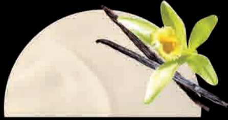
VANIGLIA Vainilla Vanilla