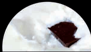
STRACCIATELLA Leche con Pepitas de Chocolate Fioridulce and Chocolate Shavings